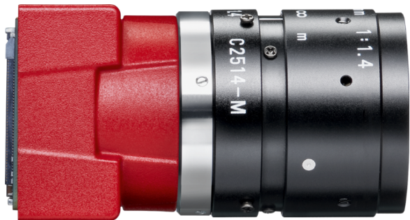
Model without hardware options